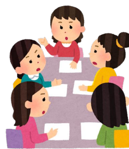
対面作業が当たり前

これまで卒園・卒業アルバムを制作する際は、先生、保護者から制作担当者を選出し、対面で作業（アルバム掲載写真の選定、制作会社とのやり取り等）を行う必要がありました。「はいチーズ！オンラインアルバム」は、オンライン上で行うことができるサービスで、2018年にリリースし好評をいただいてきました。今年度はとくに 新型コロナウイルスの感染拡大によって、対面での作業が難しいため、お問合せの数が増えています。